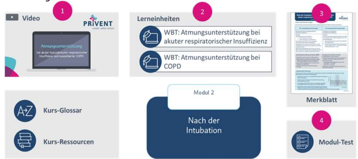
Abbildung 1: Didaktischer Aufbau

Die 7 Module umfassen Erklärvideos, webbasierte Lerneinheiten, Merkblätter sowie Tests zu Wissensüberprüfung und zum Erhalt von Fortbildungspunkten (Ärztchamber und Registrierung beruflich Pflegenden). Darüber hinaus gibt es modulübergreifende Bereiche.