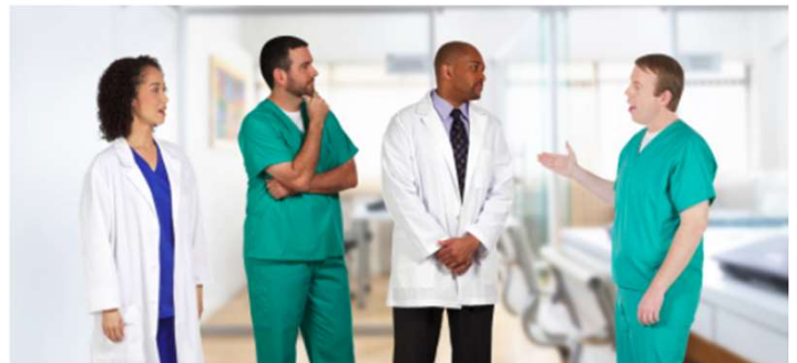
Abbildung 2: Fiktive Patientenfälle

Anhand von multimedial aufbereiteten Patientenfällen aus dem fiktiven Hochalbk-Krankenhaus können die Teilnehmer die gelernten Inhalte direkt anwenden.