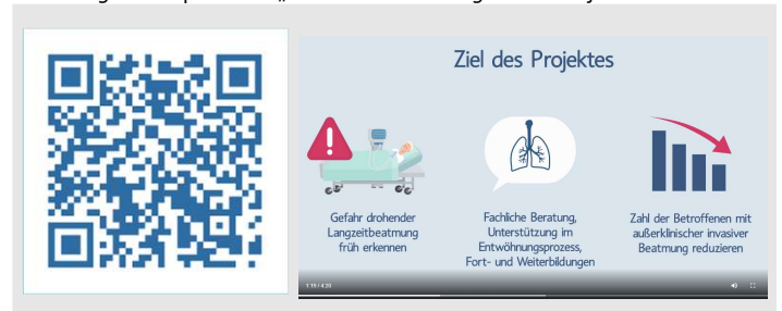
Abbildung 3: Beispielvideo „Modul 1 Einführung in das Projekt“

Screenshot des QR-Codes zum Erklärvideo des ersten Moduls „Einführung in das Projekt“ https://www.common-sense-training.de/PRiVENT/PRiVENT_Erklaraevideo.mp4 .